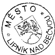
starosta města Lipník nad Bečvou